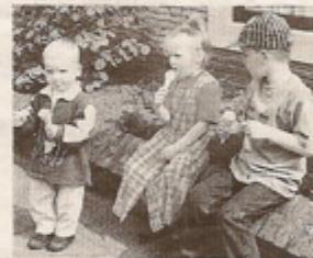
Na de herrie even rustpauze op een muurtje in de Wever met een lekker ijsje