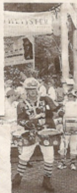
De swingende vertonning juist blijkt van een lange