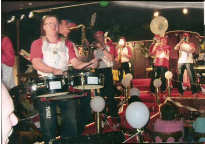
TUMULT IN VIERLINGSBEEK TIJDENS DEUTSCHE ABEND 2003: