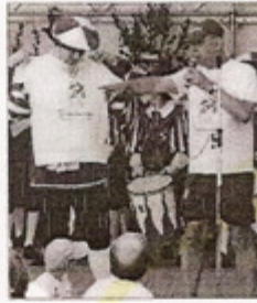
Ernung des Fanfarenzugs der Narrenzunft Vetter Guser durch die Gäste aus Boxmeer (Jusokapelle De Joekels)