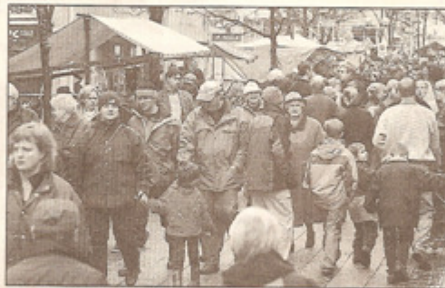
Myller. Storgatsbacken var full av personer som trängdes mellan marknadsständer.

Flickorna hoppade och gav sig inte förrän timman var över. Resultatet blev över förväntan.