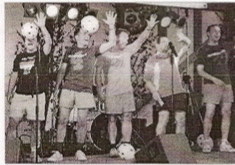
Stimmung am Samstagabend mit der Schwaben-Rockband "Gonzo"

deutschen Fußballmannschaft noch eingheizt, so dass es am Samstagabend im Festgebiet fast kein Durchkommen mehr gab. Auch bei den Bewirtern waren durchweg positive Gesichter zu sehen, zumal die heiße Witterung mächtig Durst machte. Allen Anwohnern sei nochmals herzlich für ihr Entgegenkommen und ihre Nachsicht für die Unannehmlichkeiten, die so ein Fest direkt vor der Haustür mit sich bringt, gedankt!