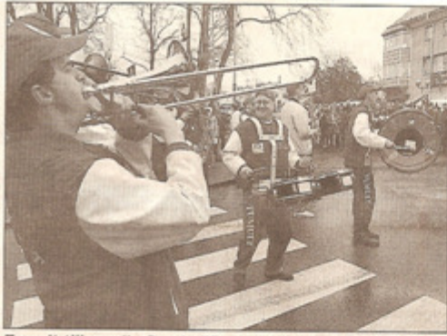
Tumult till musik. Den holländska orkestern Tumult gjorde verkligen skål för namnet när de med sin glada musik drog igång både spex och långdans.