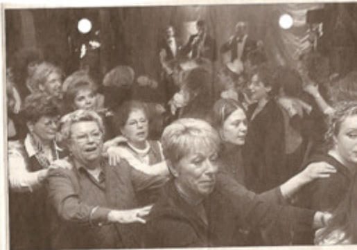
Vrouwenmorgen in Alverna.