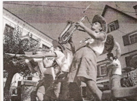
Die "Hofkapel Tumult" aus Boxmeer heizt den Sigmaringern so richtig ein.