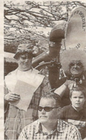
De jury incognito in actie

en was het goed toeven Met een dweilorkest en at wils. Muziekleefheb- fting dweilorkest en len, het springkussen of de kraampjes in de win- tie terrassen vonden de