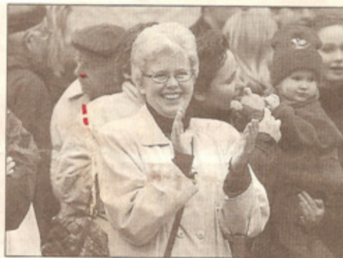
Applåder. De olika aktiviteterna och främträdandena utmed Storgatan rönste stor uppskattning under friveckolördagen.